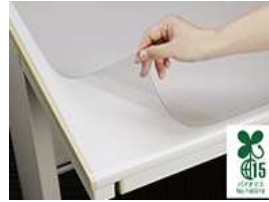
バイオマスデスクマット