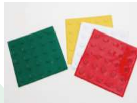
室内用点字ブロックマット